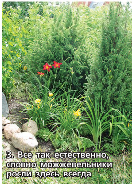
3. Все так естественно, словно можжевельники росли здесь всегда