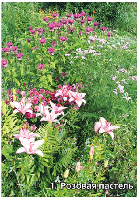
1. Розовая пастель

Терпению наступает предел: хочется в сад, на природу! Вот поэтому в садоводстве все популярнее становится природный, или пейзажный стиль.