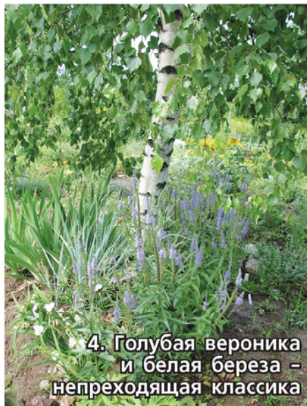
4. Голубая вероника и белая береза - непреходящая классика