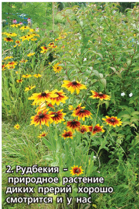
2. Рудбекия - природное растение диких прерий хорошо смотрится и у нас